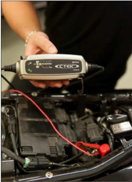
Nicholas tycker Ctek gör bra batteriladdare.