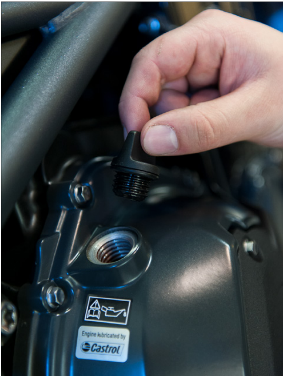
Dags att fylla på motorolja?