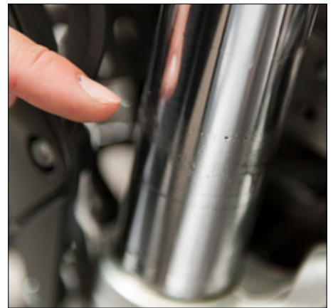
Läckande packboxar gör att dämpningen blir sämre.