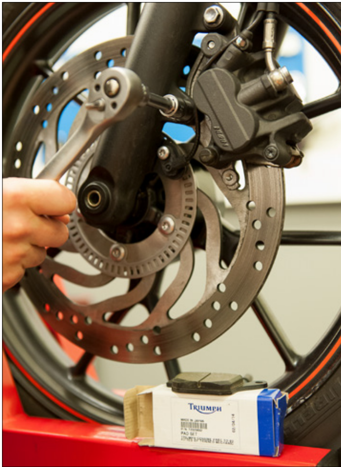
Den som glömmet att byta pads riskerar att slitna pads gör repor i bromsskivorna