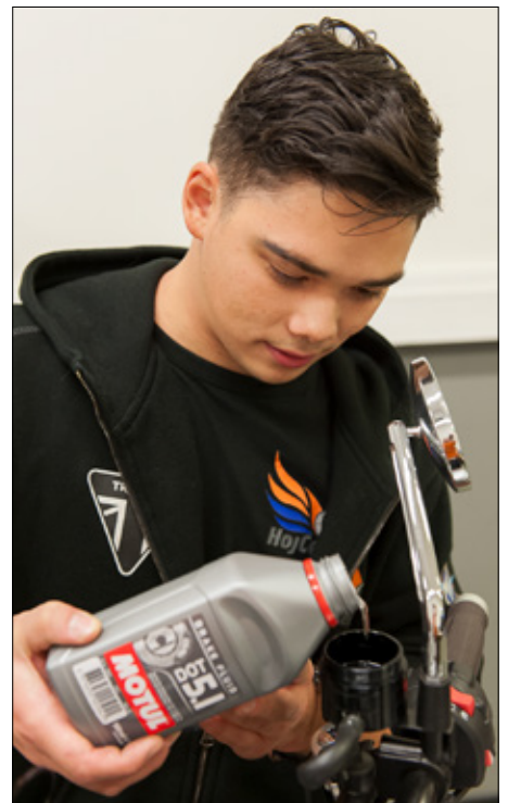
Kom ihåg att kontrollera batterisyrnivån.