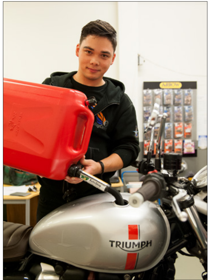
Om tanken stått tom under vintern är det viktigt att fylla på med ny, fräsch bensin.

” Nicholas menar att för den som ser sitt MC-ägande långsiktigt är våren mer av en rutinmässig avstämningspunkt och mindre av en nystart