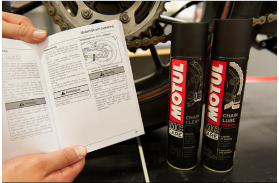
Det är viktigt att du läser instruktionsboken innan du justerar kedjans slack.