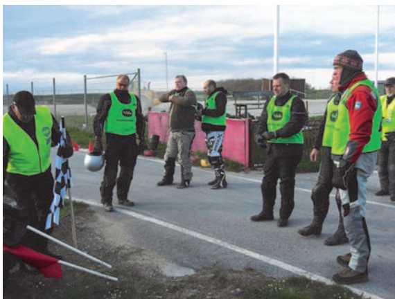
Genomgång inför övningspass

Kom och prova på denna roliga aktivitet du också, tiderna hittar du på vår hemsida och på annan plats i tidningen! VÄLKOMNA!