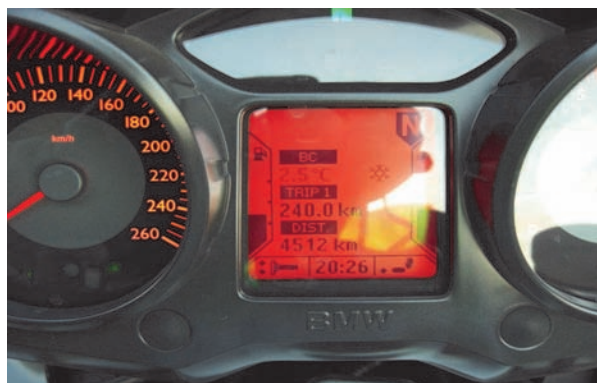
2,5 grader frostvarning blinkar!!!!