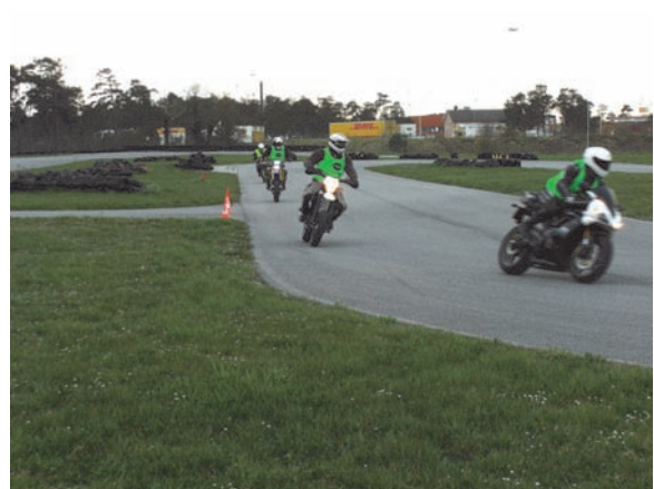
Kurvtagning /spårvals övning