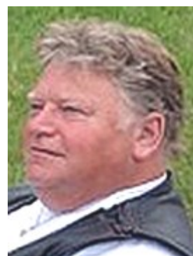
Bor: Källunge Kör: Harley FXD