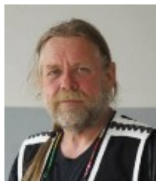
Bor: Visby Kör: HD Road King