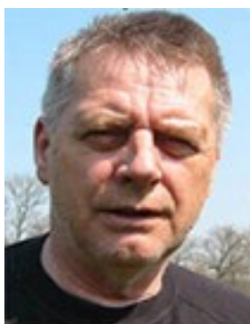
Bor: Barlingbo Kör: Kawasaki VN 2000