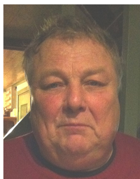
Bor: Ekeby Kör: Honda VTX