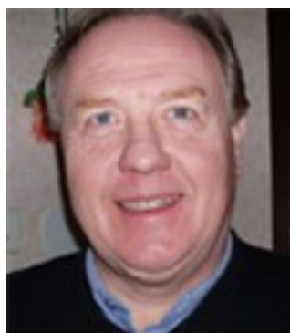
Bor: Ljugarn Kör: BMW K1300 GT KTM 690 Enduro