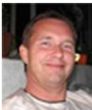
Bor: Vall Kör: Kawasaki VN1500 Mean Streak