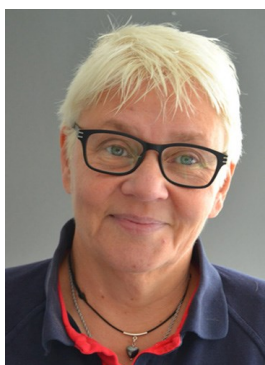
Bor: Vibble Kör: Suzuki GSX 400e 1983