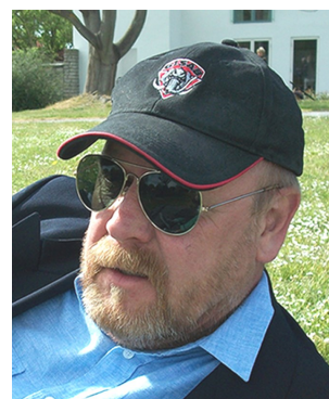
Bor: Visby Kör: Suzuki Intruder 1500