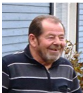
Bor: Fröjel Kör: Yamaha Dragstar 1100