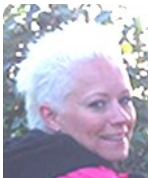
Bor: Visby Kör: Honda CBR 600 RR