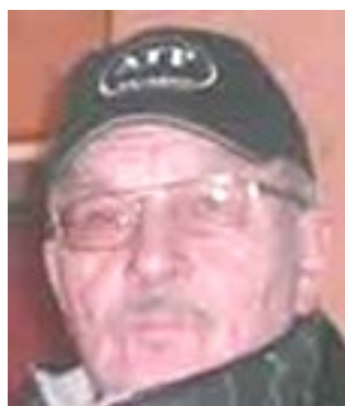
Bor: Lummelunda Kör: Kawasaki Vn 80