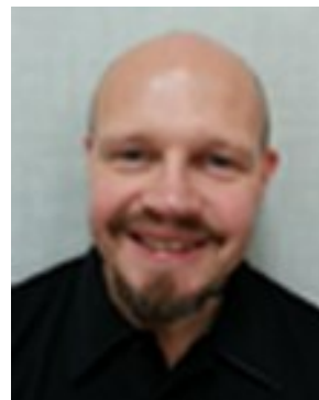
Bor: Visby Kör: Ducati Monster 1100