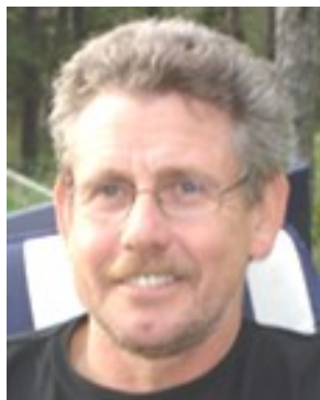
Bor: Stenkumla Kör: Honda Gold Wing