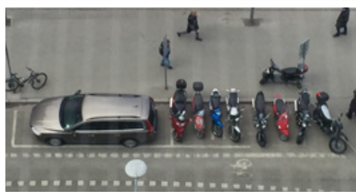
Ovan: En parkering för MC och moped klass I före införandet av P-avgifter. Nedan: Samma parkering efter införandet av P-avgifter.